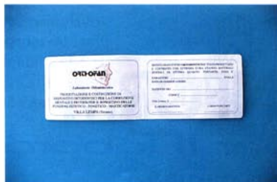
Qui sotto, la parte interna (3, a sinistra) e la terza facciata, vuota (fig. 4)

La prima, è il frontespizio del certificato (fig. 1). Il lato posteriore che è la quarta facciata, è un lato bianco (fig. 2), dove è possibile scrivere l'elenco di tutti i materiali dentali usati oppure, alcune indicazioni per il paziente da parte del professionista. Nella parte interna del certificato, c'è la seconda facciata dove compare il logo del laboratorio (fig. 3) che ha fabbricato il manufatto ortodontico mentre, la terza e più importante facciata (fig. 4), è quella che va riempita indicando la durata della garanzia, nome e cognome del paziente, codice per il riconoscimento dell'apparecchio in laboratorio, data